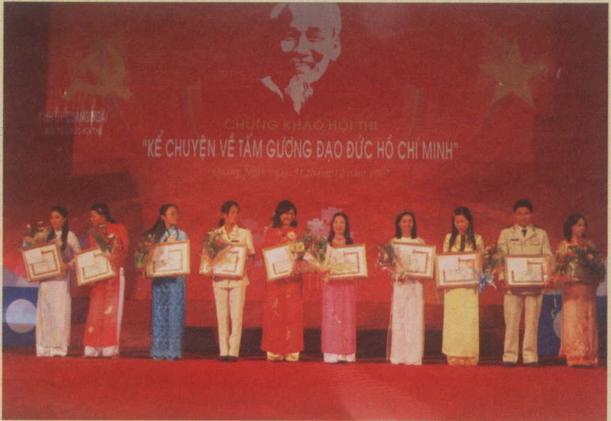
Chung khảo Hội thi "Kể chuyện tấm gương đạo đức Hồ Chí Minh" tỉnh Quảng Ngãi, tháng 12 năm 2007