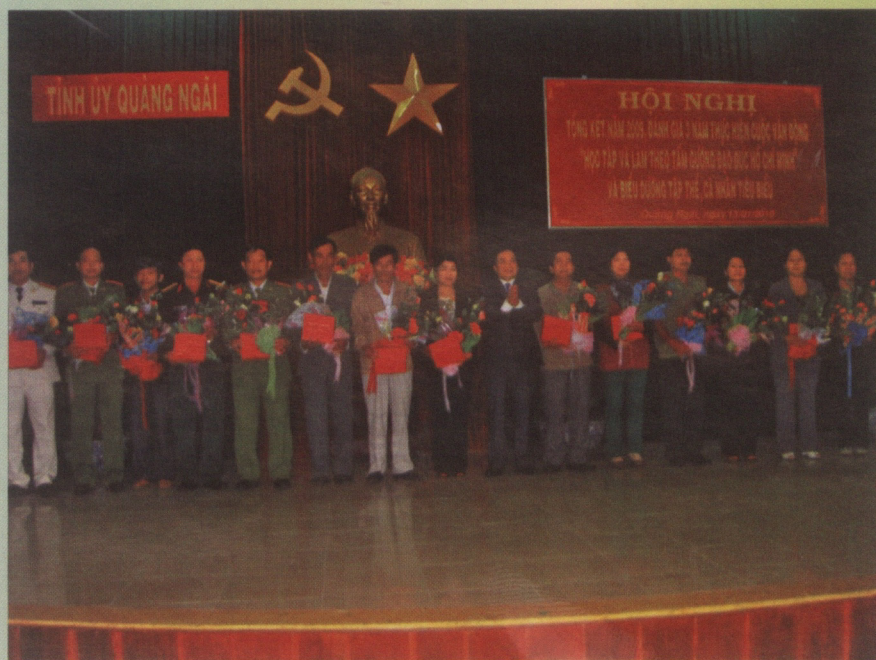
Hội nghị sơ kết 3 năm (2007 - 2009) thực hiện Cuộc vận động "Học tập và làm theo tấm gương đạo đức Hồ Chí Minh" tỉnh Quảng Ngãi, tháng 1 năm 2010