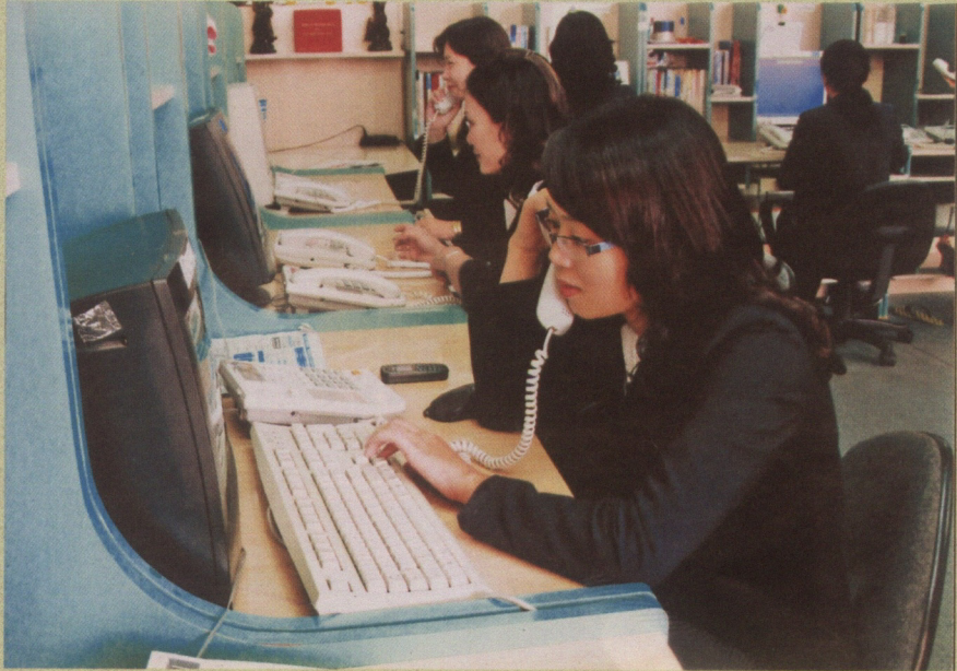
Tập thể cán bộ, nhân viên Đài 108 - Công ty Viễn thông Quảng Ngãi - một trong những tập thể điển hình trong thực hiện Cuộc vận động (2007 - 2010)