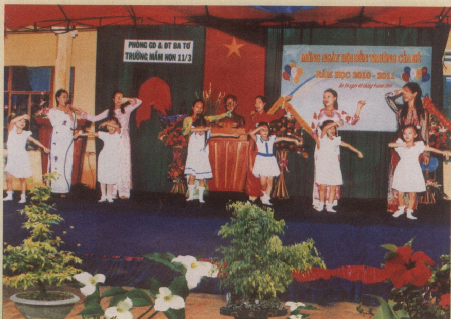
Tập thể cô và trò Trường Mầm non 11-3 huyện Ba Tư - một trong những tập thể điển hình trong thực hiện Cuộc vận động (2007 - 2010)