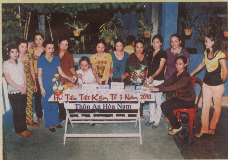
Phụ nữ Quảng Ngãi tích cực hưởng ứng Cuộc vận động "Học tập và làm theo tấm gương đạo đức Hồ Chí Minh" bằng những việc làm thiết thực, hiệu quả.