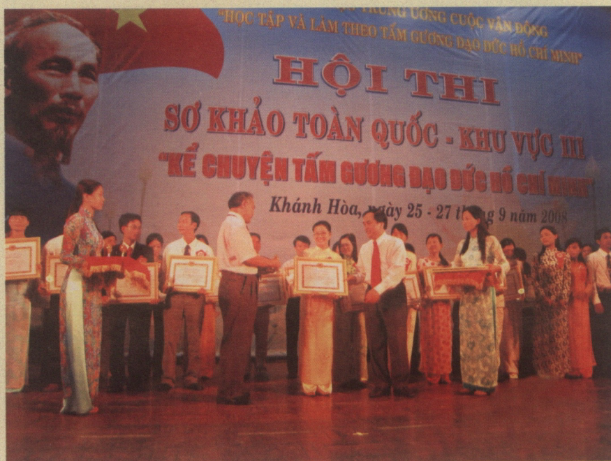
Các thí sinh tỉnh Quảng Ngãi tham gia Hội thi sơ khảo toàn quốc "Kể chuyện tấm gương đạo đức Hồ Chí Minh" do Ban Chỉ đạo Cuộc vận động Trung ương tổ chức tại Nha Trang, tháng 9 năm 2008.