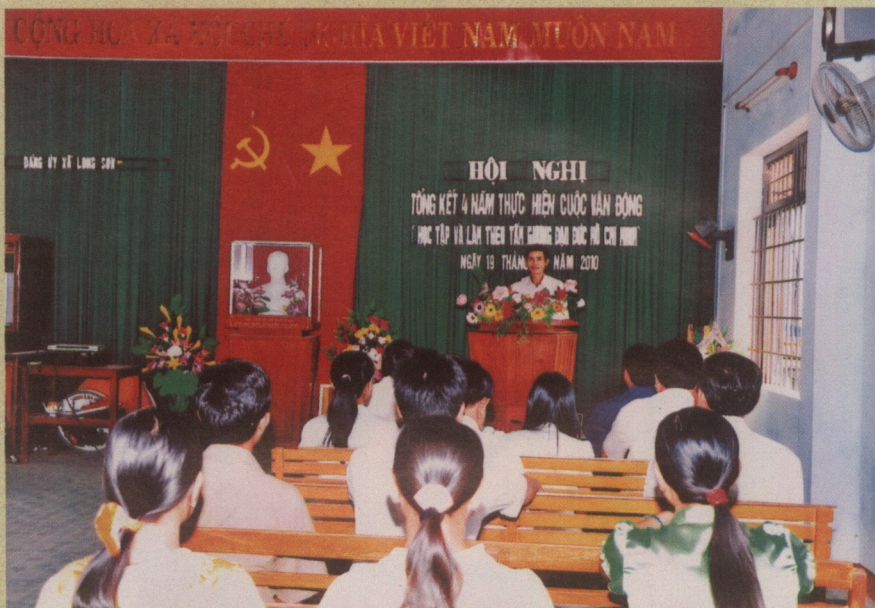
Quang cảnh Hội nghị Tổng kết 4 năm (2007 - 2010) thực hiện Cuộc vận động "Học tập và làm theo tấm gương đạo đức Hồ Chí Minh" ở một xã miền núi