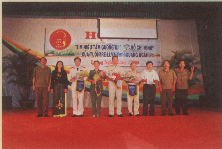
Hội thi tìm hiểu tấm gương đạo đức Hồ Chí Minh của tuổi trẻ lực lượng vũ trang tỉnh Quảng Ngãi, tháng 7 năm 2009