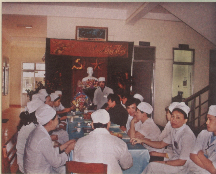
Tập thể cán bộ, nhân viên Bệnh viện đa khoa huyện Sơn Tịnh - một trong những tập thể điển hình trong 4 năm thực hiện Cuộc vận động (2007 - 2010)