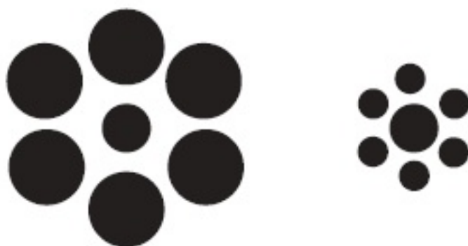
Hình 1: Hình tròn nằm giữa nào lớn hơn?

Hãy nhìn vào những chấm tròn ở hình 1. Theo bạn, chấm tròn giữa ở hình nào lớn hơn? Câu trả lời là cả hai đều có kích thước như nhau. Nhưng nhiều người cứ cho rằng chấm tròn ở hình thứ nhất lớn hơn ở hình thứ hai. Đó là một ảo tưởng của tri giác. Chính những chấm tròn xung quanh đã đánh lừa cảm giác của ta, khiến ta nghĩ rằng chấm tròn này lớn hơn chấm tròn kia.